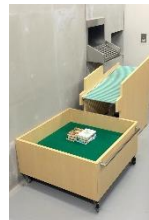
北側ブックポストの内側

図書館の入口に設置されたブックポストを裏から見るとこんなふうになっています。返却口から入れられた資料(本)はローラーのついたコンベアを伝って大きな木製のボックスにためられます。このローラーの下にはセンサーが設置されていて、「仮返却」がかけられます。一度に何冊もの本を入れると読みきれませんので一冊ずつ入れてくださいね。仮返却された本はスタッフが汚れや破れなどをチェックした後「本返却」をかけます。