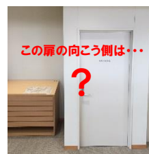
この扉の向こう側は…

「調べ物のお手伝いカウンター」の奥、「学校貸出図書室」の隣にあるのが「図書館会議室」。ここは、図書館に関するあらゆる打ち合わせが行なわれる場所。時には外部のお客様をお招きして会議が開かれることもあります。また、講座やセミナーの開催時には講師の控え室にもなります。