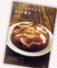
『りんごのかんたんおうち菓子』 内田真美 / 著、主婦と生活社 (請求記号 L596.65)