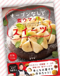
『オープンなしで激ウマッ!スイーツ』 you / 著、KADOKAWA (請求記号 L596.65)