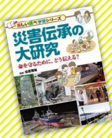
『災害伝承の大研究』 佐藤翔輔 / 監修、PHP 研究所 (請求記号 369.3)