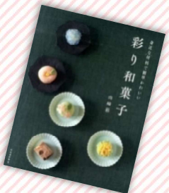
『身近な材料で簡単かわいい彩り和菓子』 山崎彩 / 著、河出書房新社 (請求記号 L596.65)