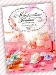
『マシュマロフォンダント』 関有美子 / 著、日東書院本社 (請求記号 L596.65)