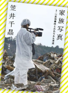
『家族写真』 3.11 原発事故と忘れられた津波』 笠井千晶 / 著、小学館 (請求記号 369.3)