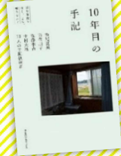
『10年目の手記』 震災体験を書く、よむ、編みなおす』 瀬尾夏美 / 著、他、生きのびるブックス (請求記号 369.3)